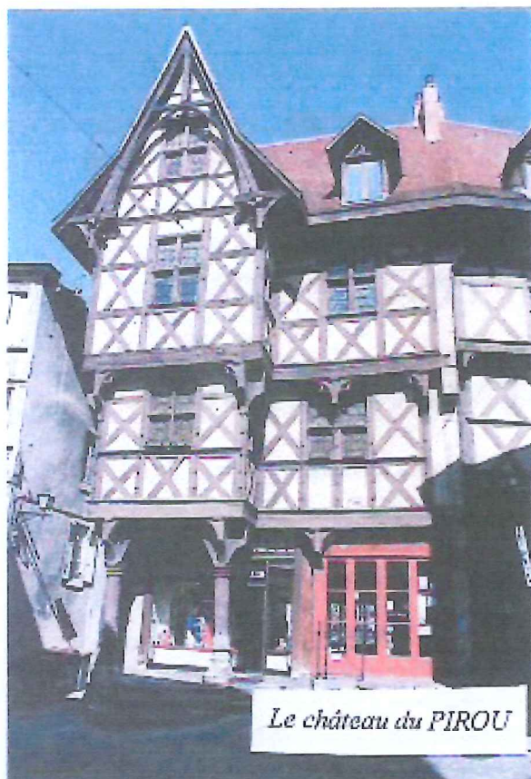
Le château du PIROU